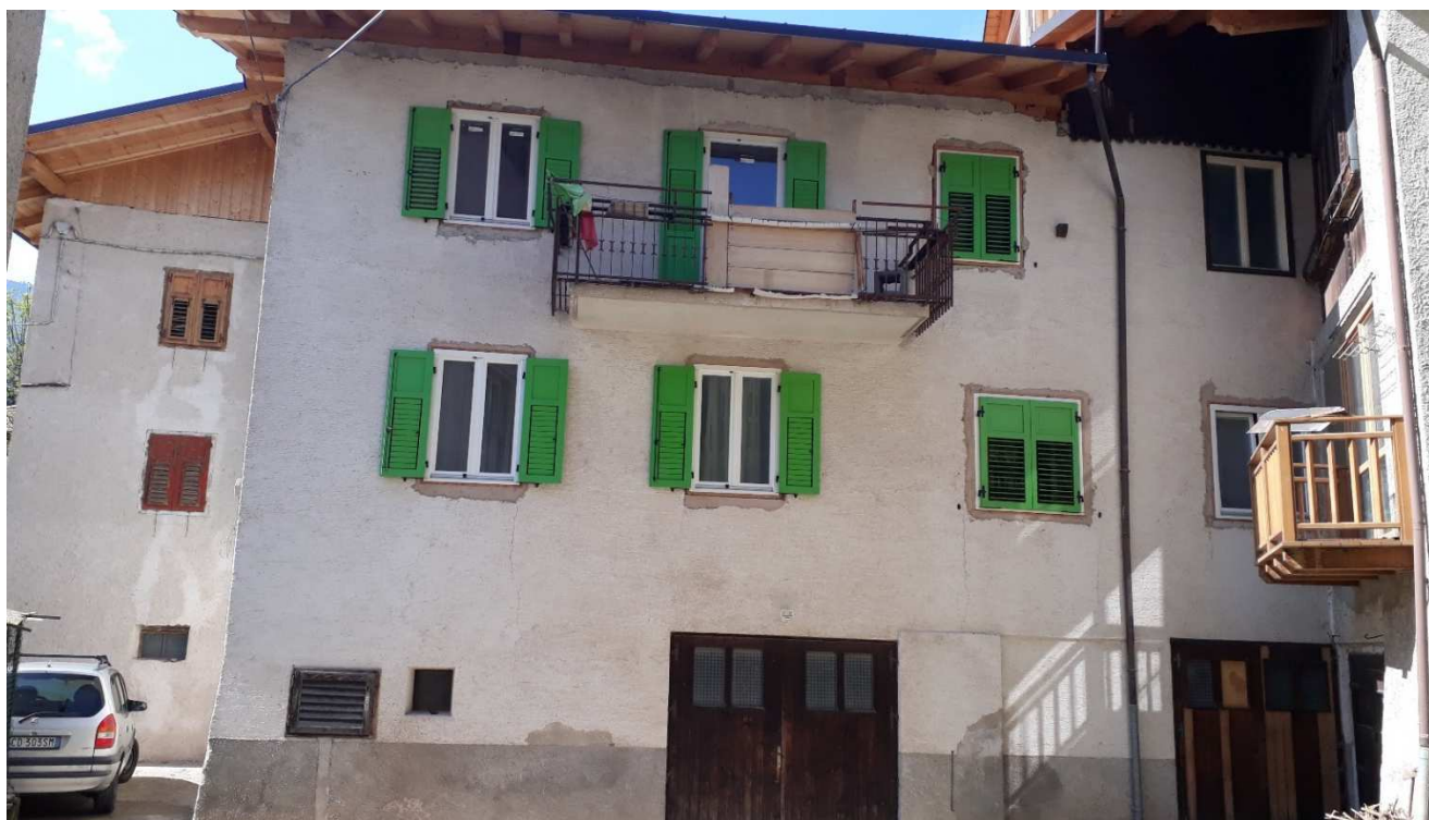
Vista da sud