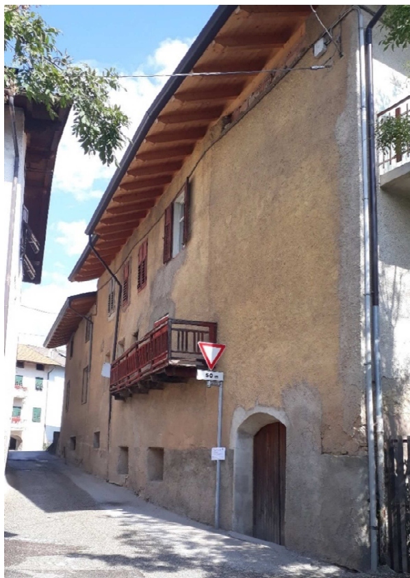
Vista da ovest