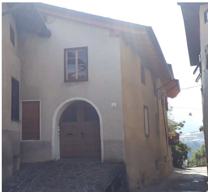
Vista da est